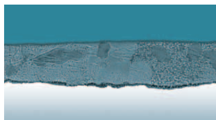
Поперечное сечение покрытия Galvalloy®

Выше изображены структуры различных металлических покрытий. Благодаря комплексной структуре сплава Galvalloy® металлическое покрытие обладает исключительной антикоррозионной стойкостью и пластичностью, чем превосходит более простые горячеоцинкованные покрытия.